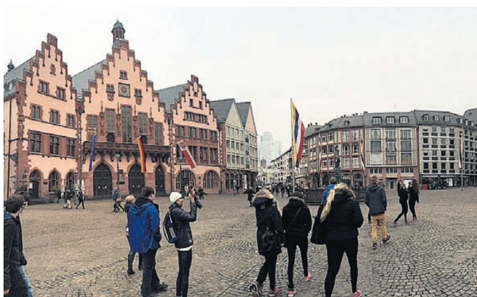
Vi går över torget Römerberg, rådhuset Römer till vänster.

Till att börja med gick vi på en guidad rundtur där vi bekantade oss med staden och dess sevärdheter. Vi fick under turen se bland an-