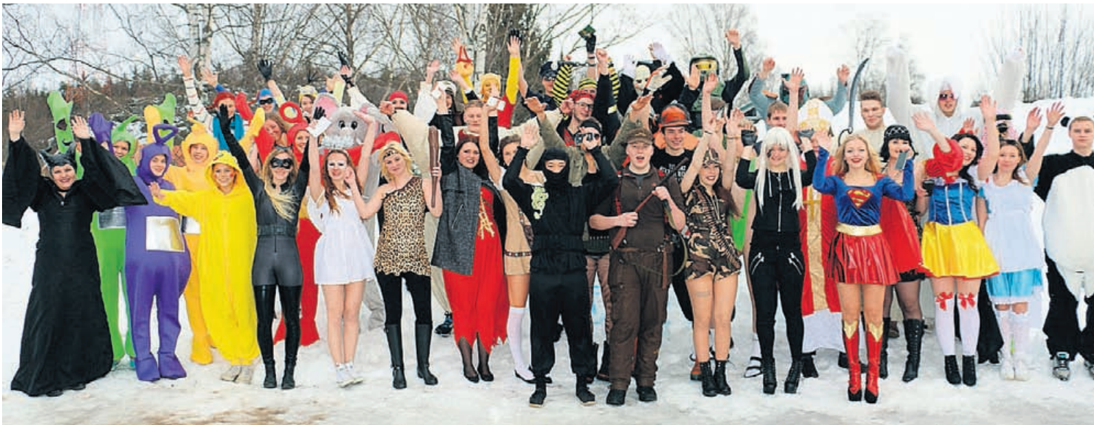
Abi 2015 vid Vörå Samgymnasium-idrottsgymnasium.