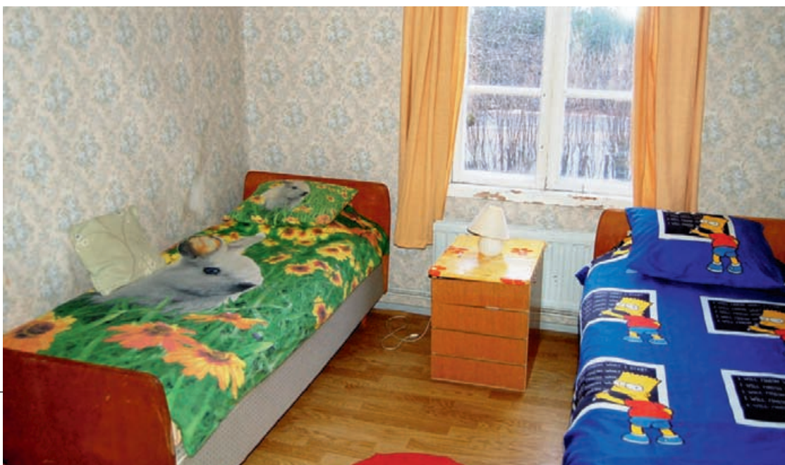
Det ena av de två sovrummen.