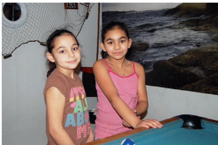
Två hyresgäster vid biljardbordet i tv-rummet.